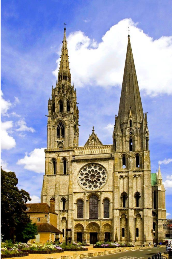
Собор в Шартре